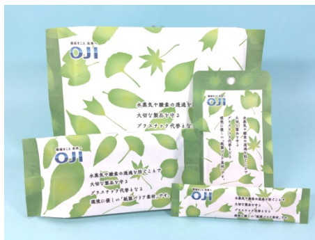
バリア性を有する包装材料

SILBIO BARRIER は食品から産業資材まで、バリア性が求められる幅広い包装用途にご使用頂けるよう、原材料を厳選して設計しております。食品接触用途では、日本製紙連合会の自主基準に沿って開発を進めており、更に、アメリカ食品医薬局(Food and Drug Administration, FDA)の使用認可リストに記載された物質のみを使用した銘柄も準備しております。