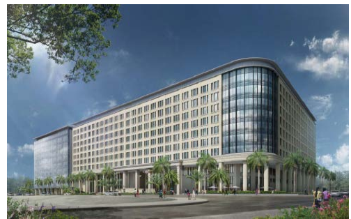
大型複合施設の外観完成イメージ