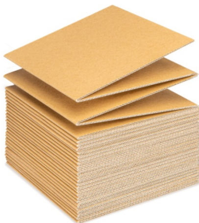
連続段ボールシート「らくだん」

連続して折り畳まれた段ボールシート「らくだん」は、3辺可変システムと組み合わせることで、商品に合わせたぴったりサイズの箱で梱包することができます。王子グループの強みである段ボール製造技術に加え、最新の連続段ボールシートの生産技術を導入し、高品質の「らくだん」を供給いたします。