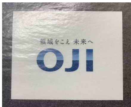
透明性の高いバリア性紙素材

当社は今後もバリア性紙素材のラインナップ拡充や品質の改良を進め、地球環境に優しい紙素材をご提案してまいります。