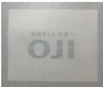
従来のバリア性紙素材