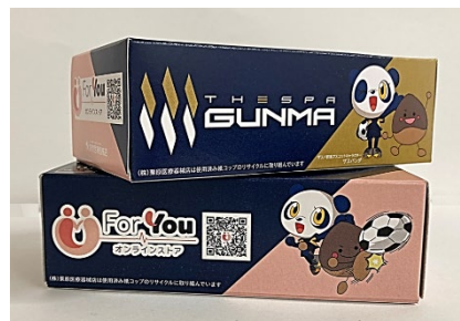
【オリジナル BOX ティッシュ】