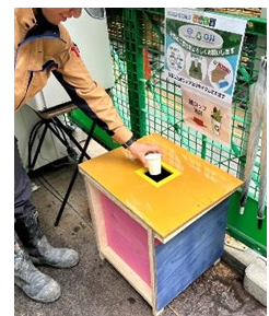
紙コップ回収の様子

紙コップは一般的に耐水性を持たせるため、プラスチックラミネート加工が施され、古紙回収に出せない禁忌品として大部分が焼却処分されており、再利用技術による有効活用が望まれていました。清水建設の「相模湖系導水路工事(※)」の現場では、業務中における飲用として紙コップを使用しています。夏季は紙コップの使用量が増加し、毎月約540個程度の紙コップを廃棄していました。そこで、従業員が使用した紙コップを分別・回収し、紙コップの繊維分(パルプ)を「nepiaハンドタオル」に再生する、マテリアルリサイクルを開始し、2024年5月から7月の間で約1200個以上の紙コップを回収いたしました。